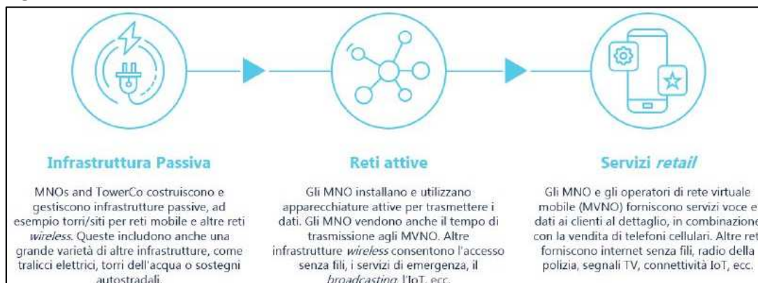
Figura 2: Le relazioni verticali nel settore delle telecomunicazioni.